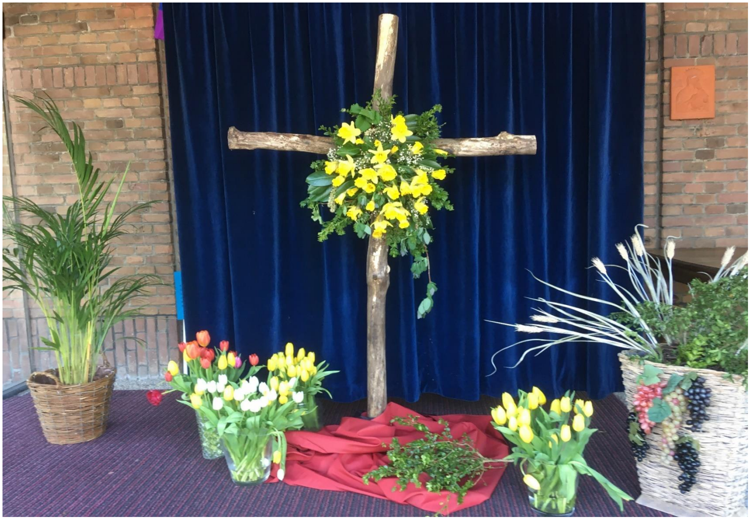
Voorportaal na Pasen