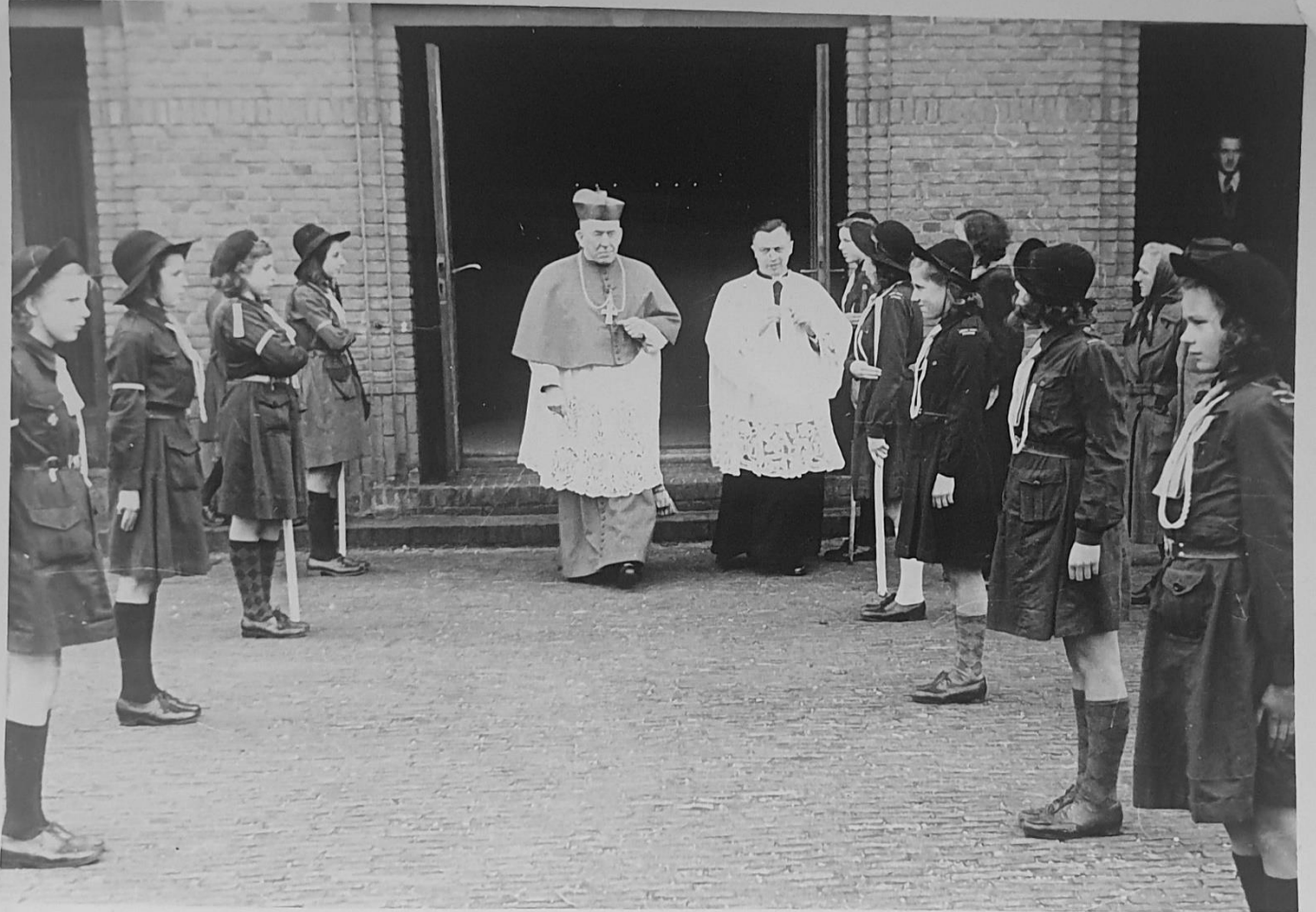
Haijdnlaan met R. K. Kerk