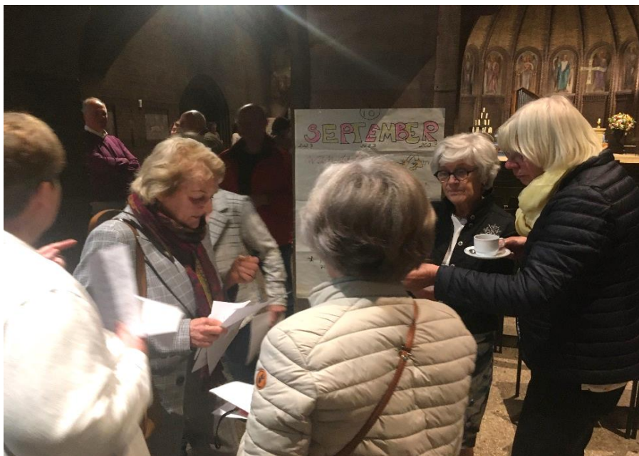
De eerste mee-doeners laten zich informeren. Hier bij de wandeldag in september.

Alle plannen moeten nog uitgewerkt worden. Er zijn vrijwilligers nodig die willen meedenken en/of de handen uit de mouwen steken. Vindt u dat leuk? Laat het s.v.p. weten aan een van de rayonhoofden of via secretariaatolvbilthoven@gmail.com . Tel. 06 45032862